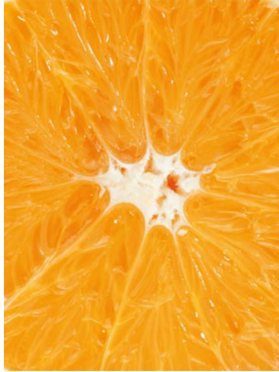
Glen Ora Late Navel