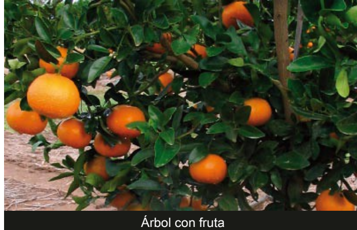
Árbol con fruta