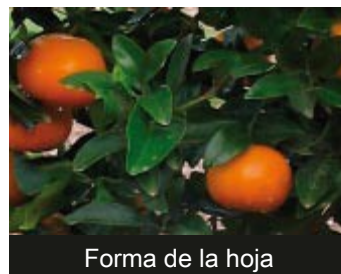
Forma de la hoja